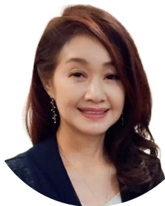
一般社団法人倫理研究所 法人局 法人スーパーバイザー

本講演会では、経営者をはじめ、共に事業を推し進める人たちの「人間力」に着目し、「企業は人なり ー経営者が変われば会社は変わるー」のテーマを掲げ、倫理経営の観点から事業繁栄のヒントを提案いたします。