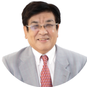
栃木県倫理法人会 法人レクチャー

2003年6月岡山県岡山市倫理法人会入会。岡山市倫理法人会幹事、副会長、岡山県倫理法人会女性委員長、岡山市倫理法人会専任幹事、岡山県倫理法人会副会長、岡山市倫理法人会会長、岡山県倫理法人会会長、相談役を歴任。2006年法人レクチャー、2021年倫理経営インストラクター、2022年より法人スーパーバイザーに就任。